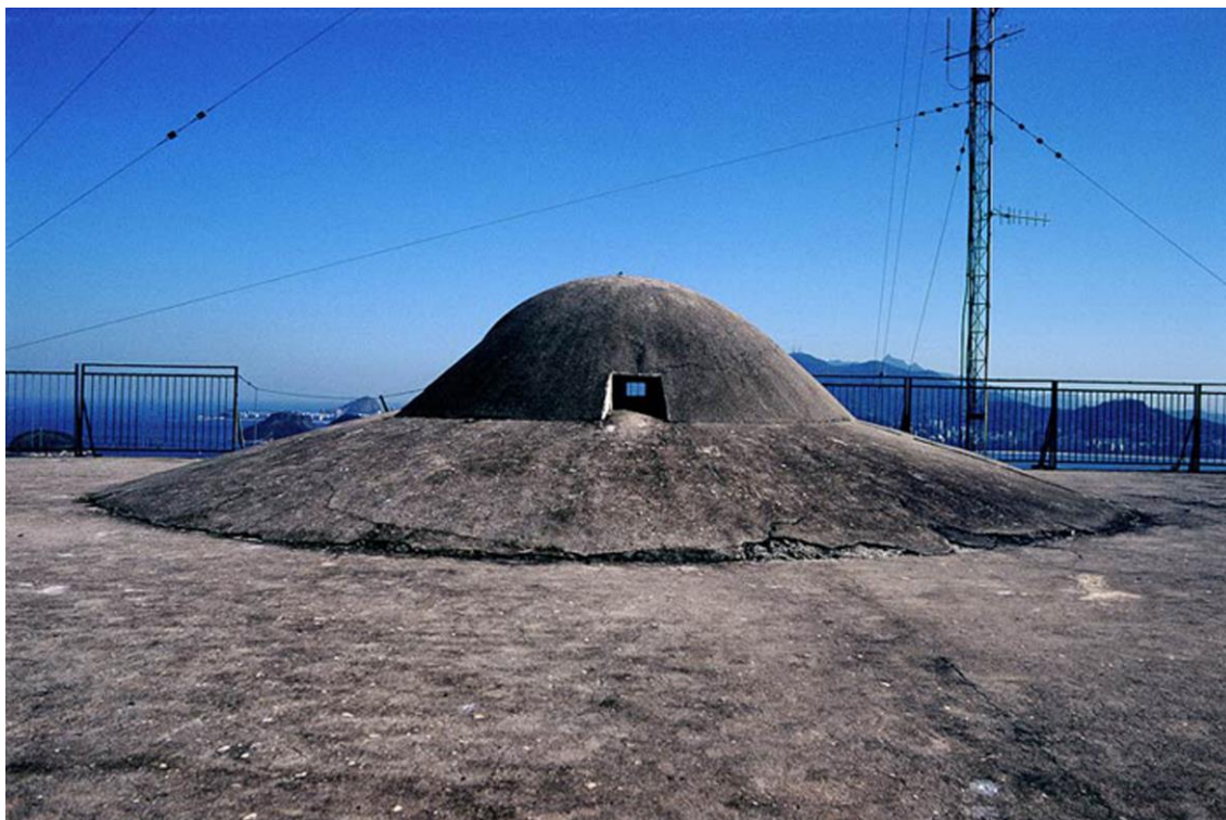
"Ovni Archive", 2007-2012.

El proyecto Ovni Archive no sólo está constituido por estas fotografías descritas, sino que lo integra un amplio material documental recopilado por la artista (recortes de periódicos, dibujos, fotografías, pequeños objetos, etc.), presentado bajo la forma de un archivo. La superficie ocupada se expande bajo un diseño museográfico que describe con precisión una larga y pormenorizada investigación científica, lo que fortalece la intención de la artista de representar y reforzar el mito.