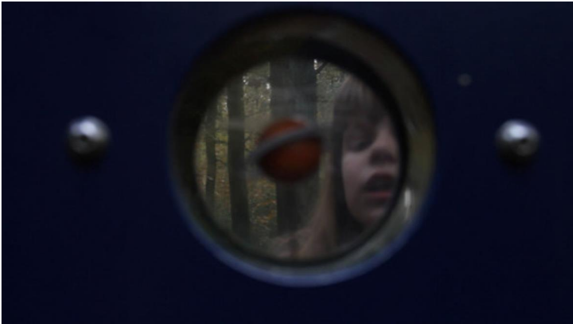
© Regina de Miguel. "Nouvelle Science Vague Fiction", 2012.

El proyecto Ovni Archive de Rosell Meseguer comenzó en 2007 cuando la artista inició una recopilación de materiales motivada por una visita a fortalezas de Río de Janeiro. Lo ha venido realizando guiada por diferentes lecturas y el hallazgo de un libro puntual ( Guerre Secrète sous les océans ), que explicaba de un modo periódico los inventos y revoluciones en el mundo de la guerra y el espionaje por mar, partiendo del submarino Peral hasta los últimos inventos del espionaje subacuático (descripción tomada en la web oficial de la artista). Aludiendo a ciudades inventadas , Rosell Meseguer se topó con búnkeres en desuso cuya arquitectura rememoraba ovnis voladores de otro tiempo con una construcción ruinosa que los asimilaba a globos partidos. La razón de ser de estas construcciones era concentrar a secretos expertos en espionaje y abrigar gigantes cámaras estenopeicas para registrar, ocultar y conservar objetos susceptibles de ser del interés del "enemigo". La recopilación de documentación por parte de la artista continuó hasta el 2011, cuando -en este caso en Berlín-, encuentra de nuevo edificaciones esféricas similares, inmensos globos de control aéreo.